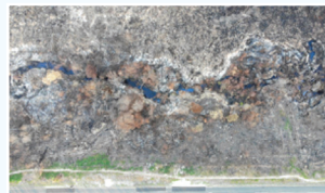
Onrusrivier 19 Februarie 2019: 07h45